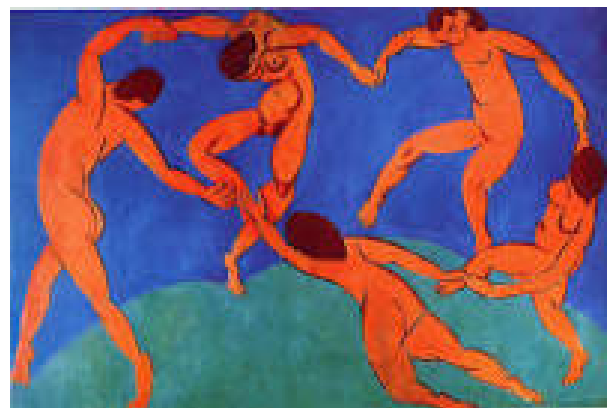
HENRI MATISSE, LA DANSE. 1910