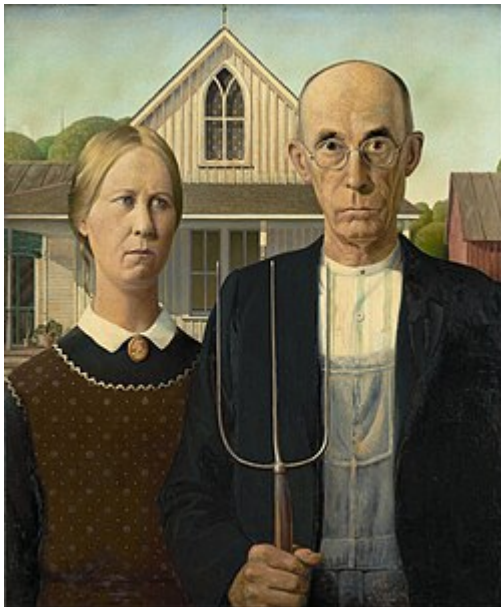
GRAND WOOD, AMERICAN GOTHIC. 1930