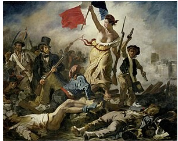
EUGÈNE DELACROIX, LA LIBERTÉ GUIDANT LE PEUPLE. 1830