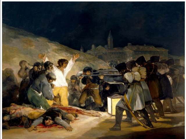
FRANCISCO DE GOYA, FUSILAMIENTOS DEL 3 DE MAYO. 1808