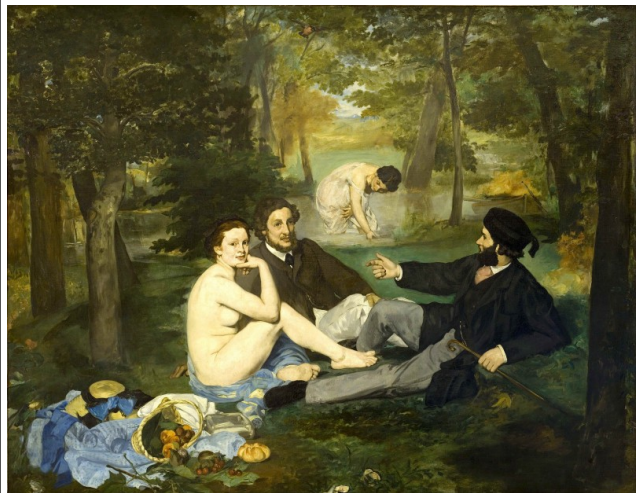
EDOUARD MANET, LE DÉJEUNER SUR L'HERBE. 1863