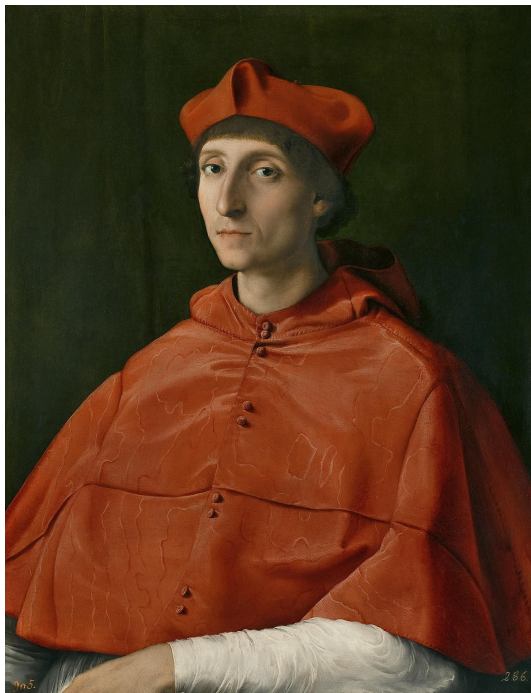
RAFAEL, EL CARDENAL. 1510