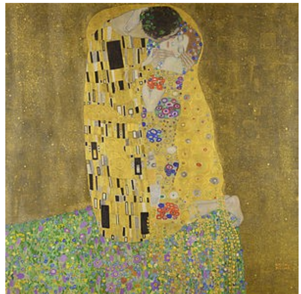
GUSTAV KLIMT, DER KUSS. 1907