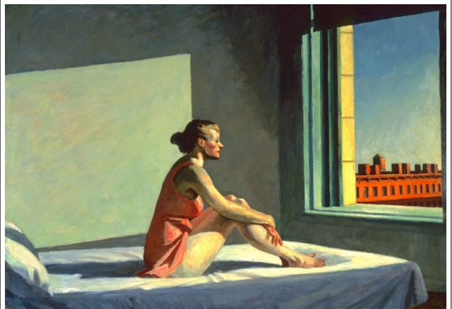
EDWARD HOPPER, MORNING SUN. 1952