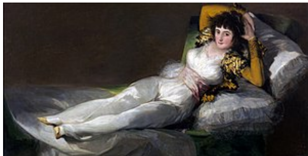
FRANCISCO DE GOYA, LA MAJA VESTIDA. 1805