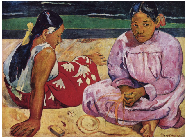
PAUL GAUGUIN, FEMMES DE TAHITI. 1891