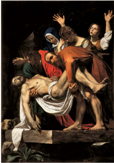
CARAVAGGIO, DEPOSIZIONE. 1604