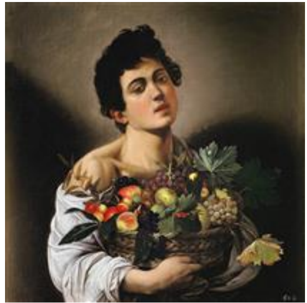
CARAVAGGIO, CANESTRA DI FRUTTA. 1596