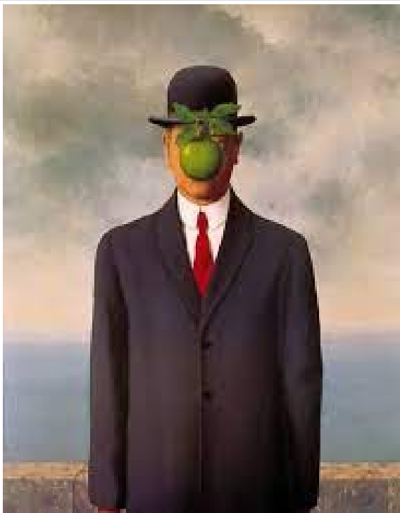
RENÉ MAGRITTE, EL FILL DE L'HOMME. 1964