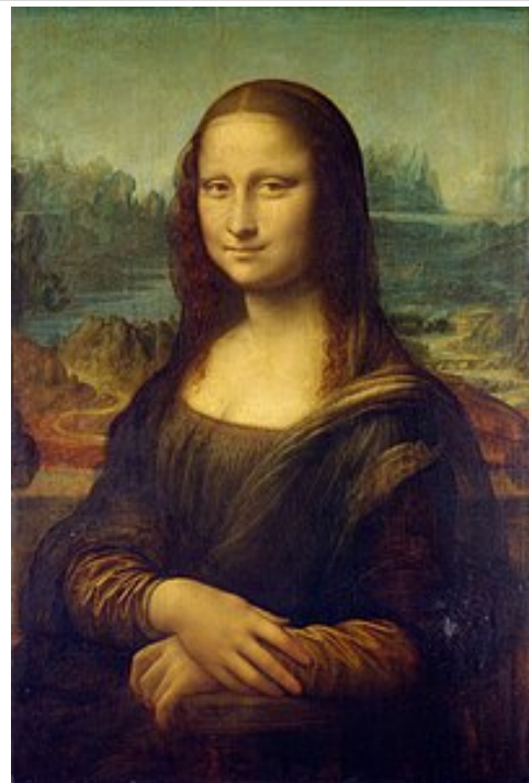
LEONARDO DA VINCI, MONA LISA. 1503