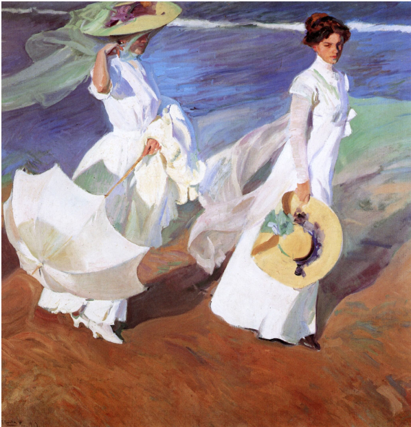
JOAQUIN SOROLLA, PASSEIG A LA VORA DE LA MAR. 1909