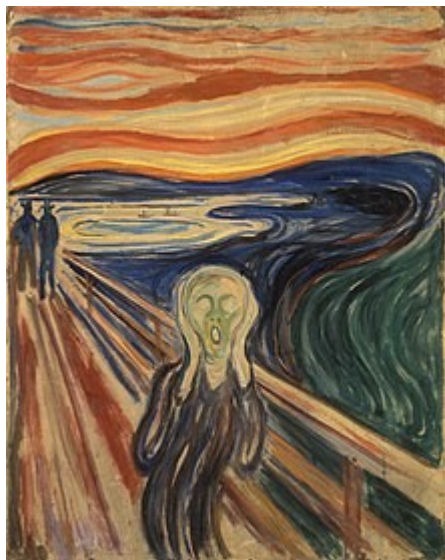
EDVARD MUNCH, SKRIK. 1893