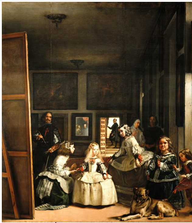
DIEGO VELÁZQUEZ, LA FAMILIA DE FELIPE IV. 1656