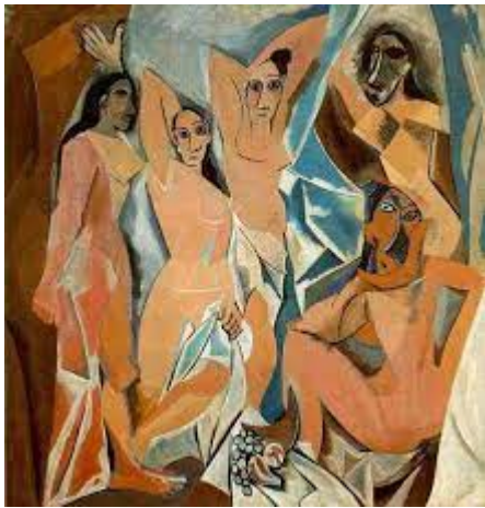
PABLO PICASSO, LES DEMOISELLES D'AVIGNON. 1907