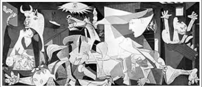
PABLO PICASSO, GERNIKA. 1937