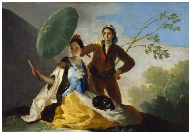
FRANCISCO DE GOYA, EL QUITASOL. 1777