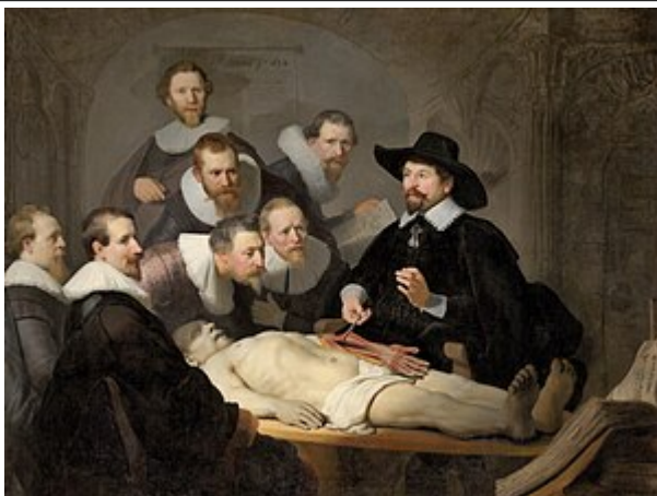
REMBRANDT, ANATOMISCHE LES VAN DR. NICOLAES TULP. 1632