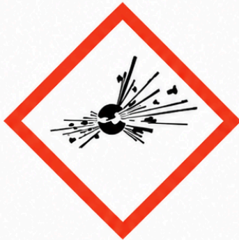
GHS01 - Explosiu

Han d'identificar-se mitjançant pictogrames i senyals de seguretat.