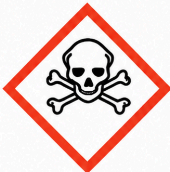
GHS06 - Tòxic