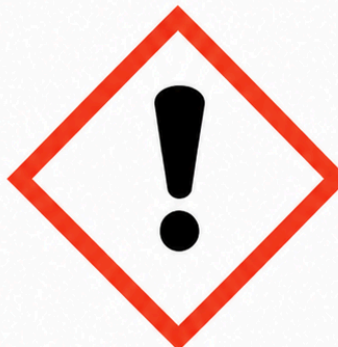
GHS07 - Nociv, irritant, narcòtic, perillós