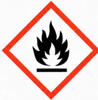
GHS02 - Inflamable