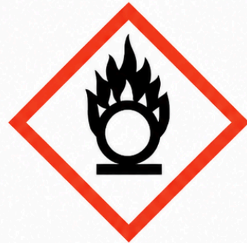
GHS03 - Comburent