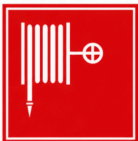
Mànega contra incendis