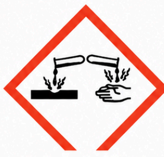
GHS05 - Corrosiu