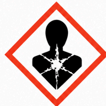
GHS08 - Perillós per a la salut, mutagèn, carcinogen, tòxic per a la reproducció