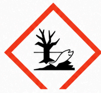
GHS09 - Perillós per al medi ambient