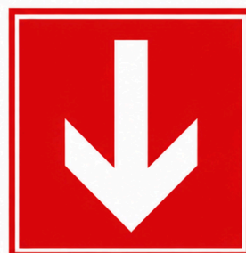
Direcció que cal seguir (senyal indicativa addicional a les anteriors)