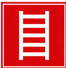
Escala de mà