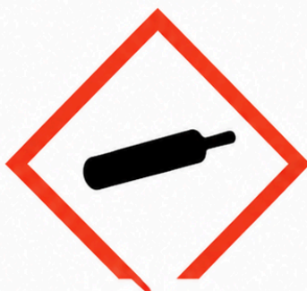
GHS04 - Gas a pressió