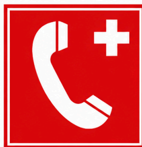
Telèfon per a la lluita contra incendis