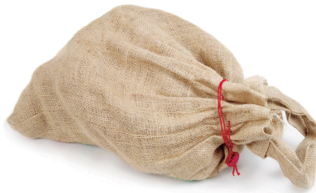
Envoltori de cotó.