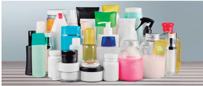
Diferents envasos de polipropilè.