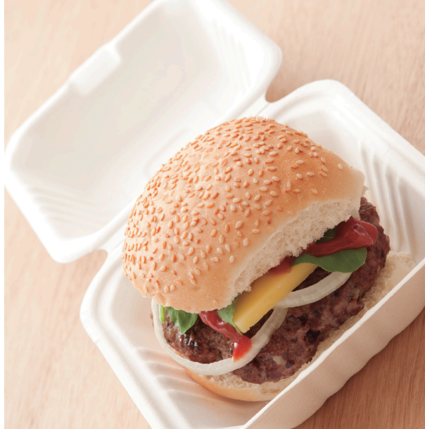
Hamburguesa a un estoig de cel·lulosa.