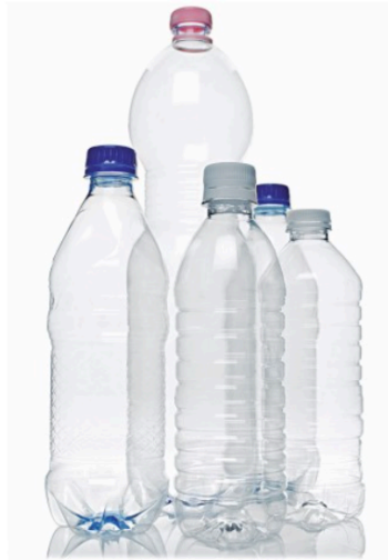
Botelles de PVC.