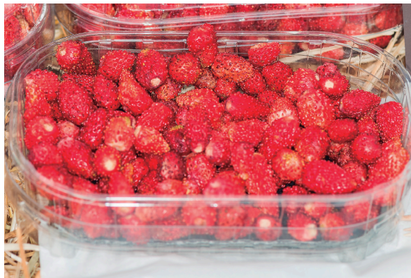
Fruita en un envàs de TNT.