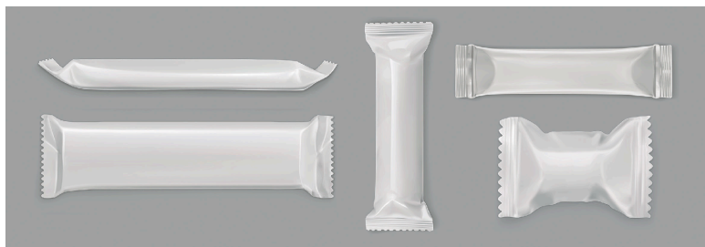
Embolcall de polietilè.