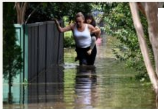
Inundación en Windsor, al noroeste de Sídney, Australia.

El Gobierno de Australia, que ha pagado subvenciones a unas 330 000 personas afectadas por las inundaciones, ha desplegado unos 4400 soldados en Nueva Gales del Sur y Queensland para realizar tareas de limpieza y reconstrucción, según fuentes militares.