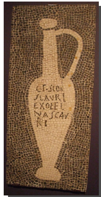
Mosaic romà d'una àmfora de garum.