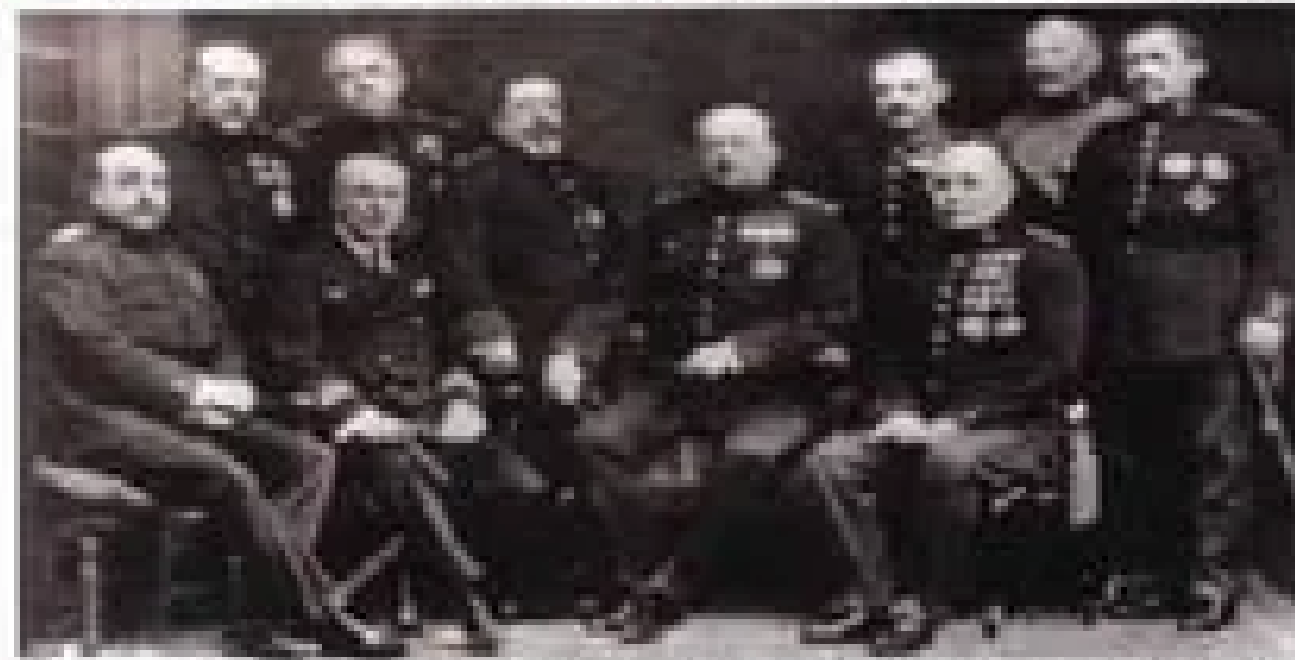
El general Primo de Rivera con los miembros del Consejo de Regeneración de España, 1923.

► El general argumenta la necesidad de regenerar España