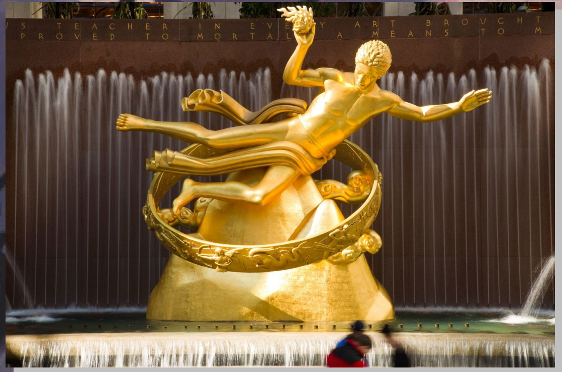
Prometeu, Paul Manship, 1934