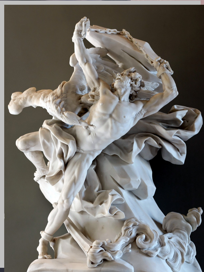
Prometeu , Nicolas-Sébastien Adam, 1762