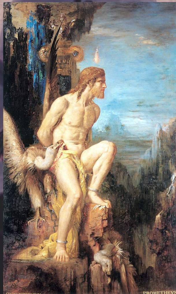
Prometeu , Gustave Moreau, 1868