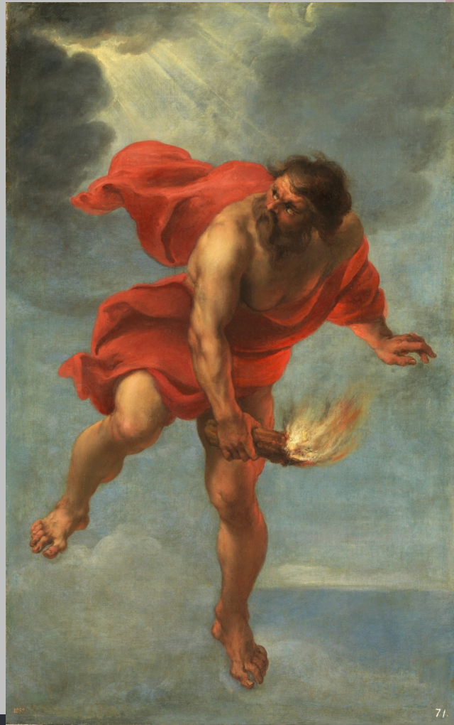
Prometeu portant el foc, Jan Cossiers, 1636-38