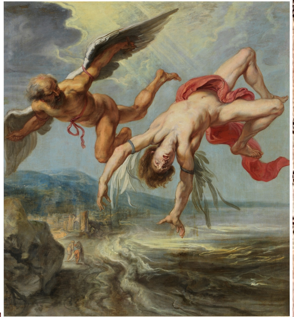
La caiguda d'Ícar , Jacob Peeter, 1636-38