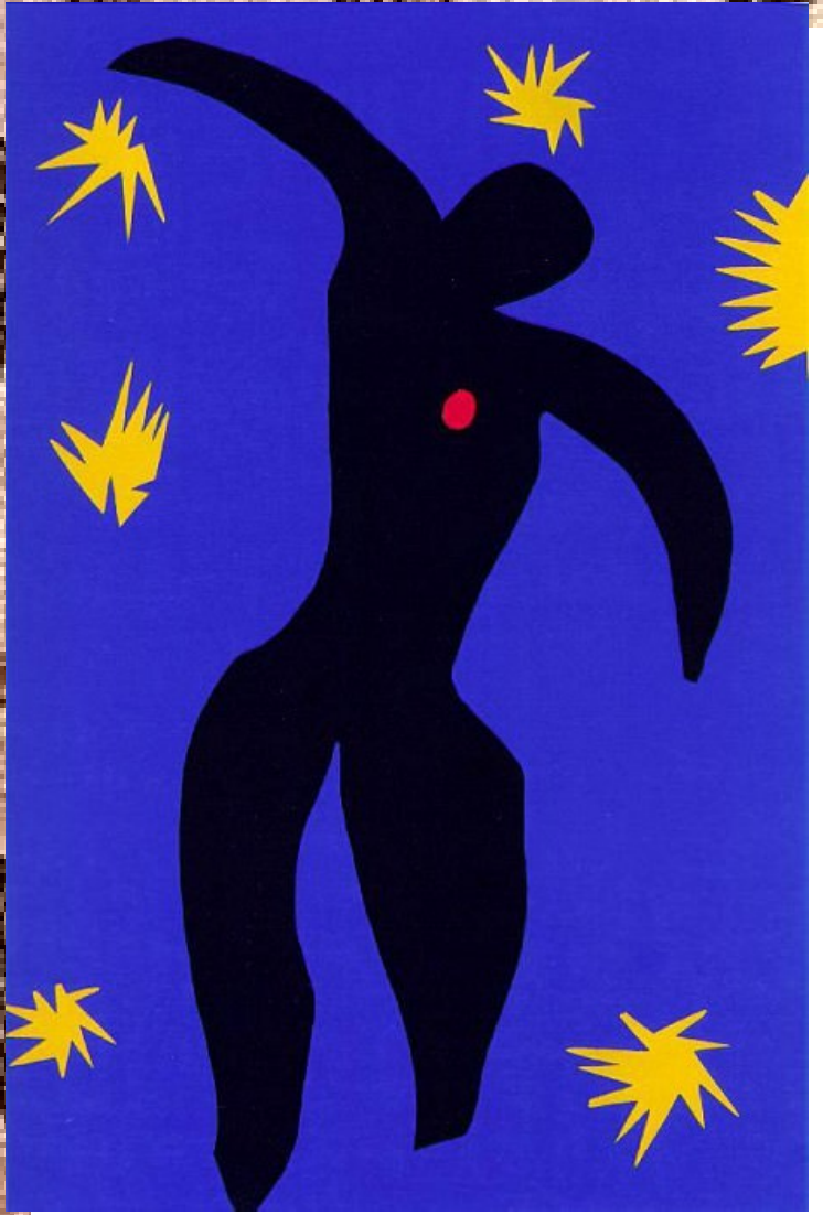
Ícar , Henri Matisse, 1947