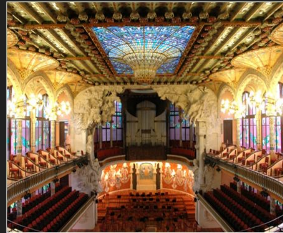
DOMÈNECH I MONTANER