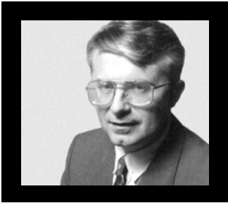
D. P. Ausubel 1918-2008

En aquest sentit, la tasca del o la professional consisteix en programar les activitats i situacions d'aprenentatge que permetin connectar activament els coneixements que es volen transmetre amb els coneixements previs de la persona.