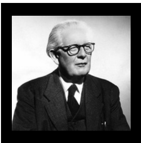
J. Piaget 1925-2021

Per a Piaget, per exemple, l'aprenentatge en la infantesa es un procés de canvi que l'autor organitza en estadis de desenvolupament (estadi sensoriomotor, preoperacional, operacions concretes i operacions abstractes). Per a passar d'un estadi a un altre cal que s'hagin assolit un nivell d'equilibri i organització mental que proporcionen prou preparació per afrontar aquest canvi. Així doncs, l'aprenentatge es presenta com un equilibri entre el medi extern (assimilació - obtenció d'informació nova de l'exterior i incorporació d'aquesta a l'estructura mental d'una persona) i l'intern (acomodació - reorganització dels elements de l'estructura).