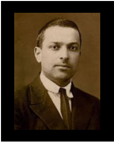
L. Vygotsky 1896-1934

Diversos exemples d'aquesta evolució els podem trobar en molts dels processos d'aprenentatge que es donen en l'aprenentatge d'autonomia personal. La importància d'aquest esquema és la importància d'establir de manera precisa en quin punt del procés cal actuar per a que es produeixi l'aprenentatge.