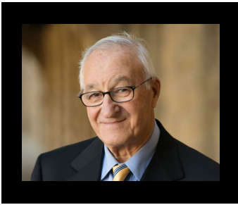
A. Bandura 1925-2021

L'aprenentatge per observació és una estratègia molt vàlida per a l'adquisició de conductes, tant espontànies com planificades.