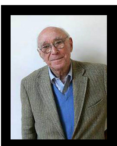
J. S. Bruner 1915-2016

També es considera fonamental el paper del o la professional que acompanya el procés i la relació que estableix amb la persona usuària