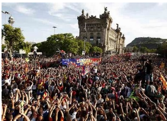
El futbol genera passions a molta gent

Es creu que ja a la Cultura Maia hi havia un joc que es desenvolupava amb una pilota i que l'anomenaven Pok ta pok, però també podríem trobar jocs similars a Groenlandia i fins i tot al continent americà.