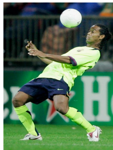
El control es pot fer amb diferents superfícies

Acció tècnica individual d' enviar la pilota a un company a través de l'impuls de la pilota amb el peu, el pit o el cap (tot i que l'habitual és amb el peu). La superfície més utilitzada del peu és l'interior (la més segura, sobre tot a passades curtes i mitges) i l'empenya interior (si la distància és més llarga).