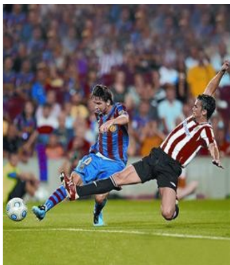
Exemple de rematada i entrada

Acció tècnica de fer-te la pilota teva i disposada per a jugar-la un altre cop . És, també, una acció bàsica del joc ja que permet que es pugui enllaçar amb altres accions de forma ràpida (com la passada o la rematada).