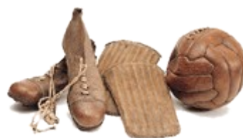
Sabates i pilota antigues

Aquestes accions es sancionen amb un tir lliure directe (que es pot posar en joc amb una rematada directa a la porteria), i, si la falta s'ha comesa a dins l'àrea de porteria de l'equip infractor, es sanciona amb un penal (tir directe des dels 11 metres (situats a l'àrea de porteria) i amb l'oposició només del porter.