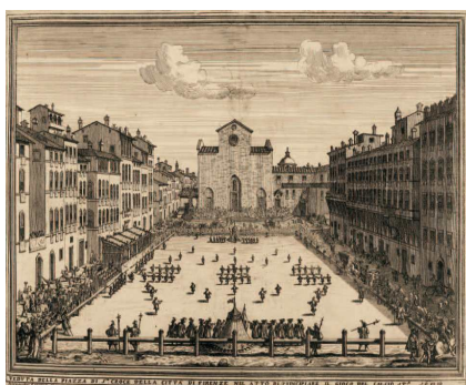
Il·lustració 2: Calcio italià

Però si parlem de futbol ens hem de fixar en l'evolució del joc a les Illes Britàniques , les quals adaptaren les variants del futbol de carnaval italià (massa violentes) i en feren un tipus d'activitats que formassin part de les activitats esportives a les classes d'Educació Física de les escoles britàniques. D'aquests jocs podríem destacar el joc de la paret, que es jugava en un camp estret amb un mur al seu costat on l'objectiu era portar la pilota a l'extrem contrari (veure figura 1), o el de Winchester, que es jugava en un camp de 73 x 24,5 mts amb xarxes laterals perquè la pilota no sortís del terreny de joc.