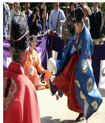
Il·lustració 1: Kemari

Però l'activitat més antiga que es sembli al futbol data dels segles II i III abans de Crist i es feien a la Xina, l'anomenaven Tsu chu o Cuju i consistia a llançar una pilota amb els peus cap a una petita xarxa, amb l'oposició dels rivals i formava part d'un tipus d'entrenament militar. També al Japó hi havia el Kemari (veure il·lustració 1), que tenia un caràcter més cerimonial i que consistia a passar-se la pilota a l'aire entre diferents jugadors del mateix equip (a Birmània hi ha un joc similar).