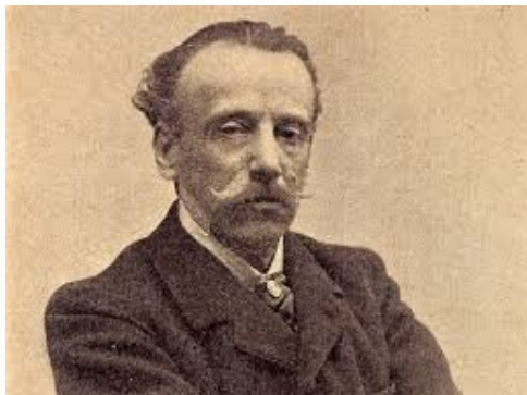
Narcís Oller NARRATIVA