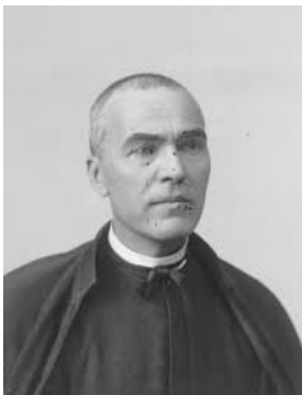
Jacint Verdaguer POESIA

25. Quin va ser el trampolí per fer créixer la nostra literatura? Cap a on va impulsar la llengua?