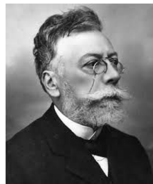
Àngel Guimerà TEATRE